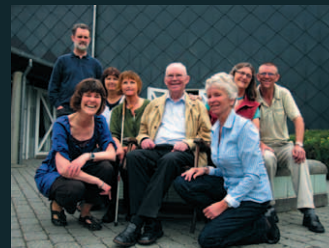
Hovedbestyrelsen er FDDBs styrende organ og vælges for to år ad gangen. Formanden og næstformanden er altid hhv. én talebruger og én tegnsprogsbruger, og der er lige mange medlemmer fra hver gruppe i bestyrelsen. HB-medlemmerne er omtalt herunder i samme rækkefølge som de står på billedet: fra venstre mod højre.